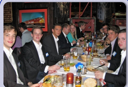
Gemeinsames Dinner im Restaurant „Chicago Meatpackers“ nahe der Europäischen Zentralbank

Das MBP e. V. bedankt sich bei allen Teilnehmern der diesjährigen Frankfurtfahrt für ein super Wochenende !